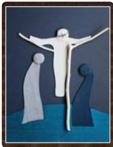
Collage und Foto: Brigitte Panis

Dann bricht Unruhe aus: Ein Schimmer neuer Hoffnung. Jesus, der Hingerichtete wird als lebendig erfahren. Maria von Magdala bezeugt ihm begegnet zu sein. Obwohl das Zeugnis einer Frau damals nicht galt, wird im Evangelium darüber berichtet. Petrus und Johannes laufen